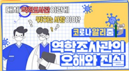
[코로나 뭐든 알리줌 4편] 역학조사관의 오해와 진실! 부산시 역학조사반은 어떤 일을 할까?