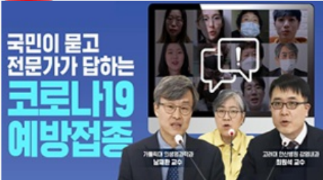
국민이 묻고 전문가가 답하는 코로나19 예방접종