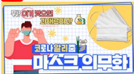
[코로나 뭐든 알리줌 3편] 뭐? 이거 벗으면 과태료 부과?! 마스크 의무화의 모든 것