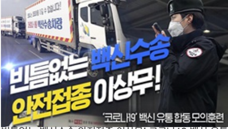
빈틈없는 백신수송 안전접종 이상무! 코로나19 백신 유통 합동 모의훈련