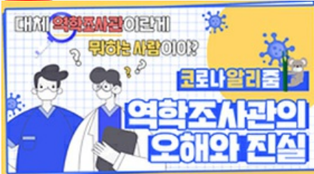
[코로나 뭐든 알리줌 4편] 역학조사관의 오해와 진실! 부산시 역학조사반은 어떤 일을 할까?