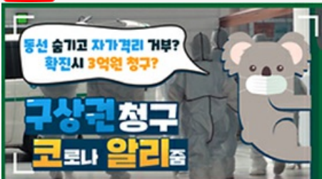
[코로나 뭐든 알리줌 2편] 동선 숨기고 자가격리 거부? 구상권에 관한 모든 것