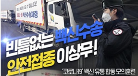
빈틈없는 백신수송 안전접종 이상무! 코로나19 백신 유통 합동 모의훈련