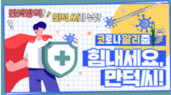
[코로나 뭐든 알리줌 5편] 힘내세요 만덕씨