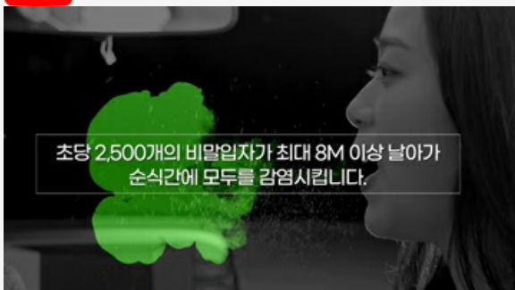
마스크를 뺏는 순간