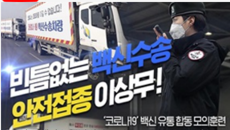
빈틈없는 백신수송 안전접종 이상무! 코로나19 백신 유통 합동 모의훈련