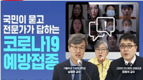
국민이 묻고 전문가가 답하는 코로나19 예방접종