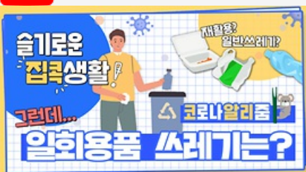
[코로나 뭐든 알리줌 7회] 우리의 지구를 부탁해 똑똑한 슬기로운 집콕생활!