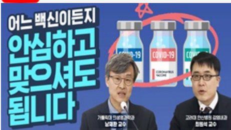
어느 백신이든지 안심하고 맞으셔도 됩니다