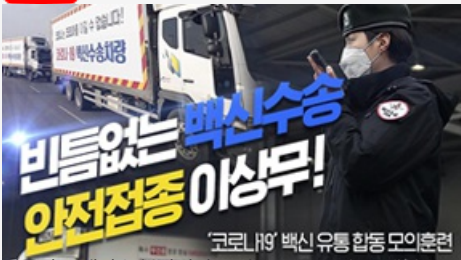
빈틈없는 백신수송 안전접종 이상무! 코로나19 백신 유통 합동 모의훈련