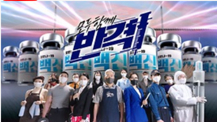
모두함께 반격! 백신접종 시작!