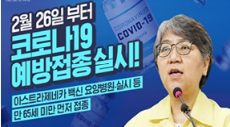
2월 26일 부터 코로나19 예방접종 실시