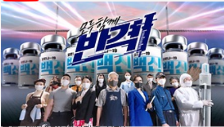
모두함께 반격! 백신접종 시작!