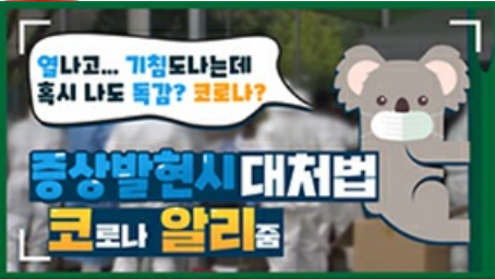
[코로나 뭉든 알리 줌 1편] 열나고 기침도 난다! 나도 혹시 똑같? 코로나?