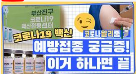
[코알리 워든 알리움 11편] 부산 코로나19 백신 예방접종 시작