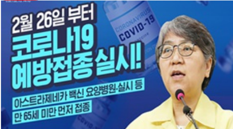
2월 26일 부터 코로나19 예방접종 실시