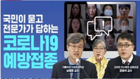
국민이 묻고 전문가가 답하는 코로나19 예방접종