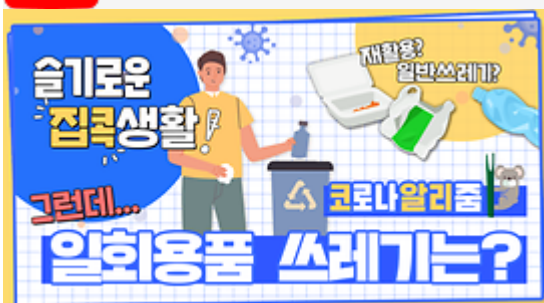
[코로나 뭐든 알리줌 7회] 우리의 지구를 부탁해 똑똑한 슬기로운 집콕생활!