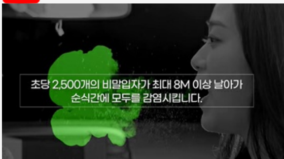
마스크를 뺏는 순간