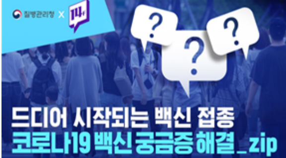
드디어 시작되는 백신 접종 코로나19백신 공금증 해결