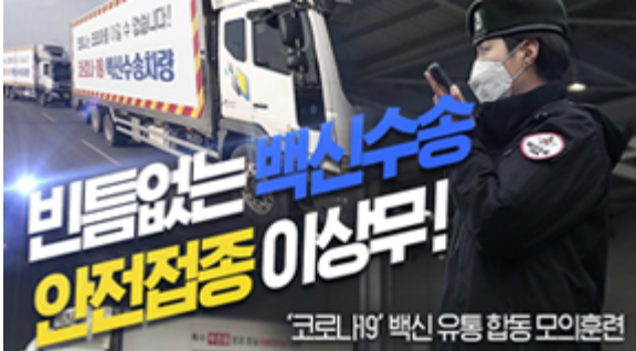
빈틈없는 백신수송 안전접종 이상무! 코로나19 백신 유통 합동 모의훈련