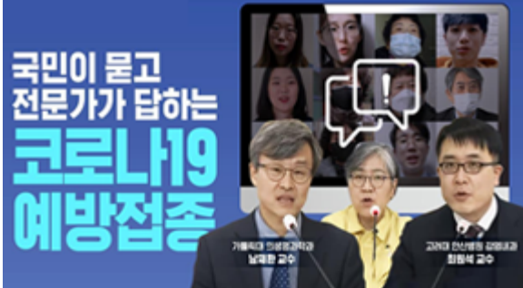
국민이 묻고 전문가가 답하는 코로나19 예방접종