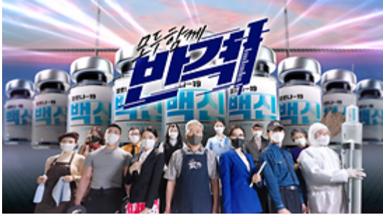
모두함께 반격! 백신접종 시작!