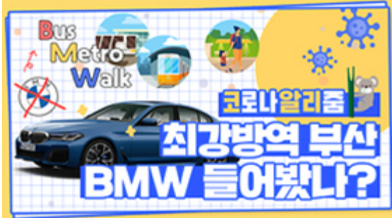
[코로나 뭐든 알리줌 6편] 부산 BMW 믿어도 되나??