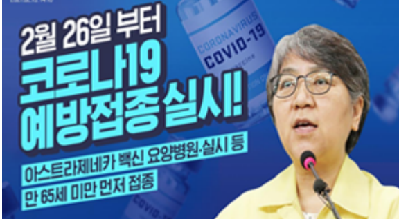
2월 26일 부터 코로나19 예방접종 실시