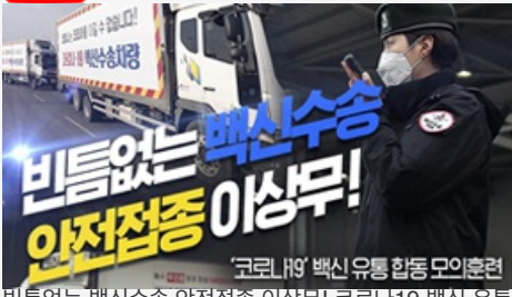
비틈없는 백신수송 안전점검 이상무! 코로나19 백신 유통 합동 모의훈련