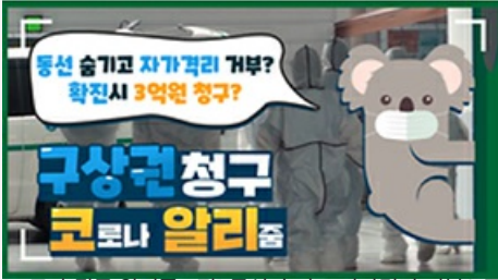
[코로나 뭐든 알리 줌 2편] 동선 숨기고 자가 격리 거부? 구상권에 관한 모든 것