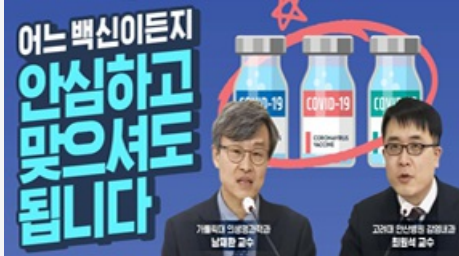
어느 백신이든지 안심하고 맞으셔도 됩니다