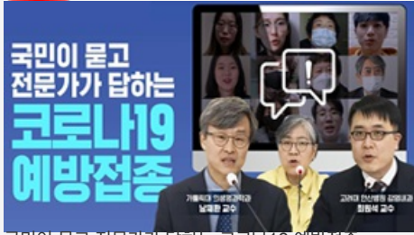
국민이 묻고 전문가가 답하는 코로나19 예방접종