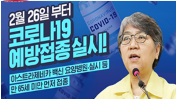
2월 26일 부터 코로나19 예방접종 실시