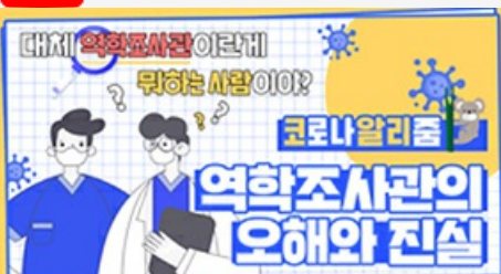
[코로나 뭐든 알리줌 4편] 역학조사관의 오해와 진실! 부산시 역학조사반은 어떤 일을 할까?