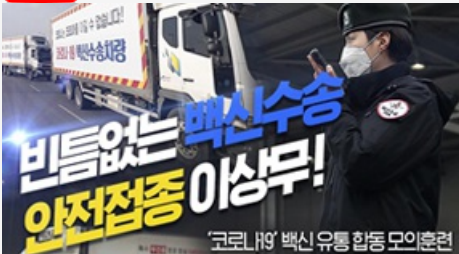
비틈없는 백신수송 안전접종 이상무! 코로나19 백신 유통 합동 모의훈련