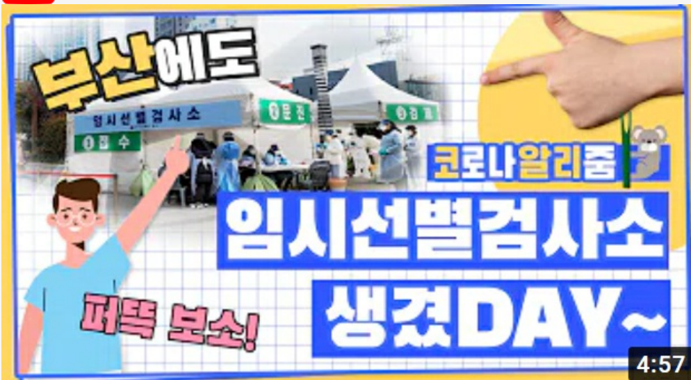
[코로나 뭐든 알리줌 9편] 부산에도 임시선별검사소 생겼DAY~