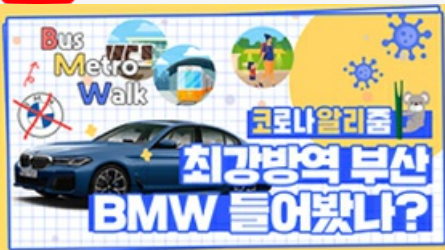
[코로나 뭐든 알리줌 6편] 부산 BMW 믿어도 되나??