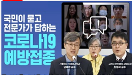
국민이 묻고 전문가가 답하는 코로나19 예방접종