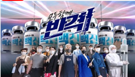
모두함께 반격! 백신접종 시작!