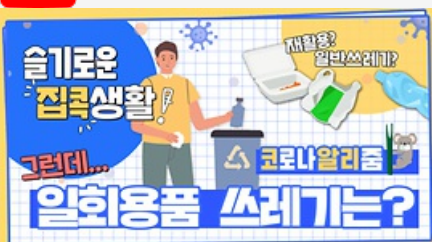
[코로나 뭐든 알리줌 7회] 우리의 지구를 부탁해 똑똑한 슬기로운 집콕생활!