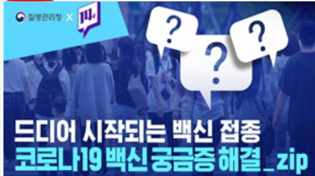
드디어 시작되는 백신 접종 코로나19백신 궁금증 해결