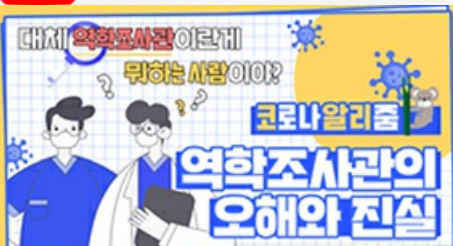
[코로나 뭐든 알리줌 4편] 역학조사관의 오해와 진실! 부산시 역학조사반은 어떤 일을 할까?