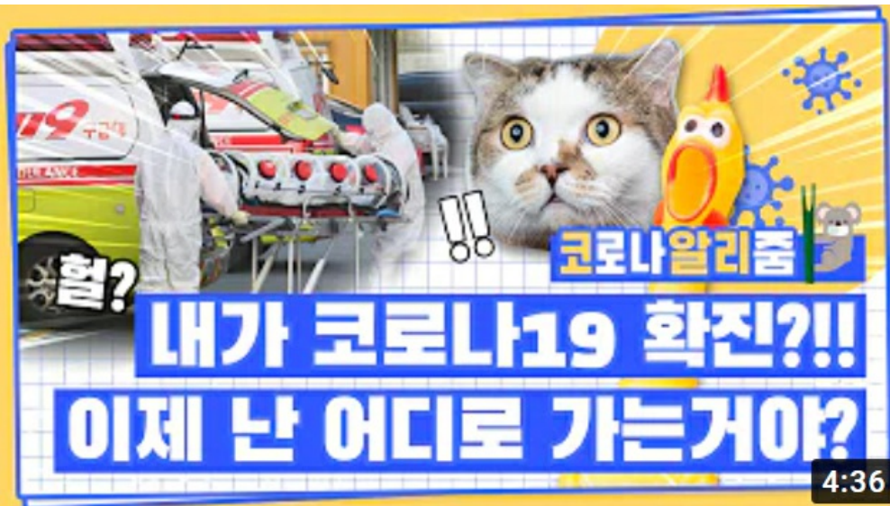
[코로나 뭐든 알리줌 8편] 코로나19 확진자가 되면 생기는 일