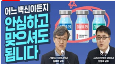
어느 백신이든지 안심하고 맞으셔도 됩니다