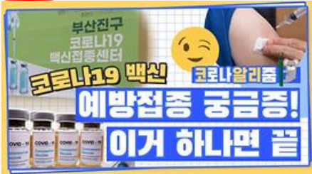
[코알리 워든 알리줌 11편] 부산 코로나19 백신 예방접종 시작