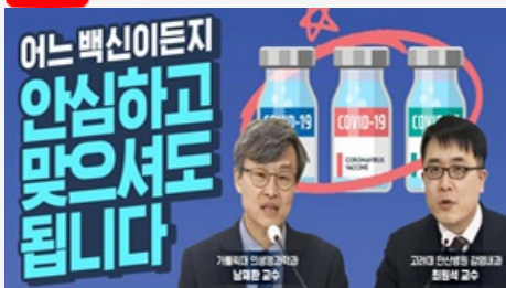
어느 백신이든지 안심하고 맞으셔도 됩니다