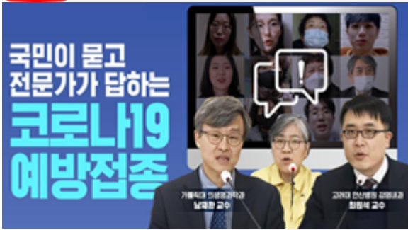
국민이 묻고 전문가가 답하는 코로나19 예방접종