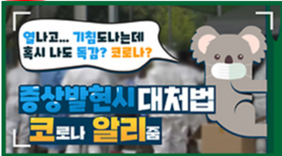
[코로나 뭐든 알리줌 1편] 열나고 기침도 난다! 나도 혹시 독감? 코로나?