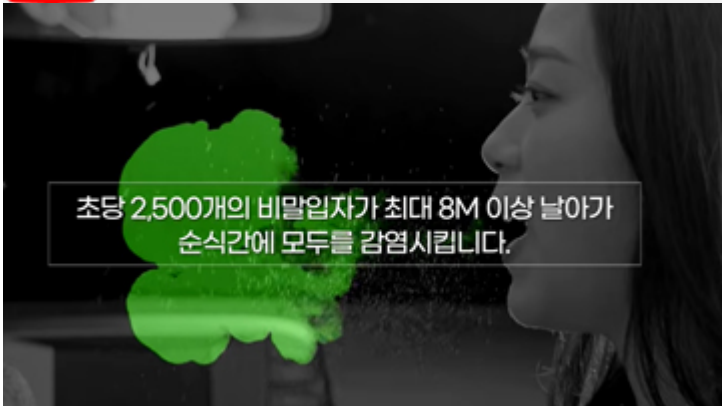
마스크를 벗는 순간