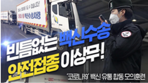
빈틈없는 백신수송 안전점검 이상무! 코로나19 백신 유통 합동 모의훈련