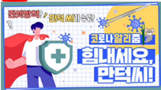
[코로나 뭐든 알리즘 5편] 힘내세요 만덕씨