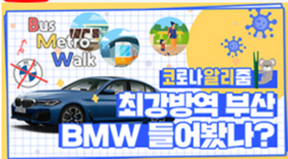
[코로나 뭐든 알리즘 6편] 부산 BMW 믿어도 되나??