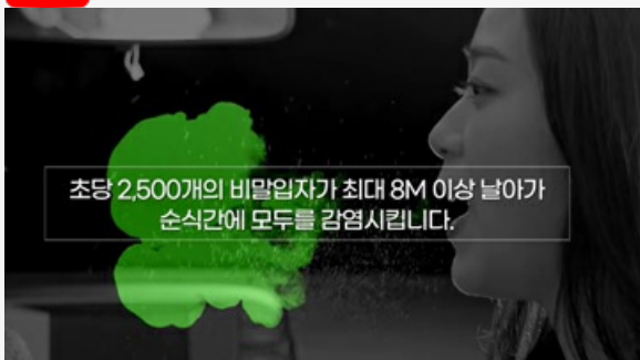
마스크를 뺏는 순간