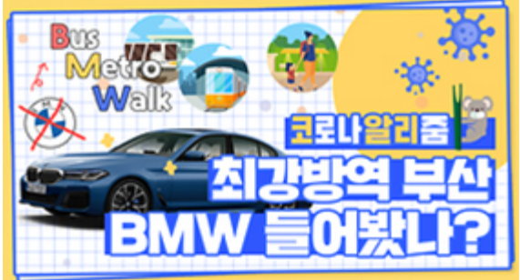
[코로나 뭐든 알리춤 6편] 부산 BMW 믿어도 되나??