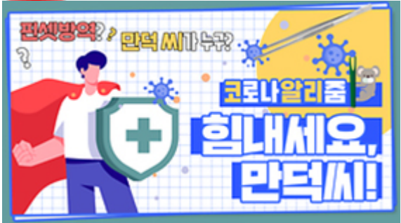
[코로나 뭐든 알리춤 5편] 힘내세요 만덕씨