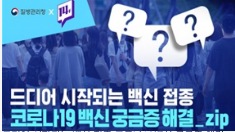
드디어 시작되는 백신 접종 코로나19백신 궁금증 해결