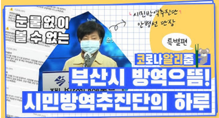
[코로나 뭐든 알리줌 10편] 부산시 시민방역추진단의 하루