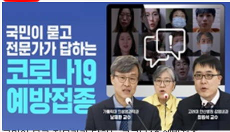
국민이 묻고 전문가가 답하는 코로나19 예방접종