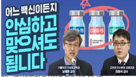
어느 백신이든지 안심하고 맞으셔도 됩니다