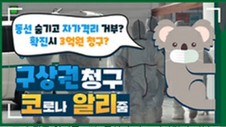
[코로나 뭉든 알리 줌 2편] 동선 숨기고 자가 격리 거부? 구상권에 관한 모든 것