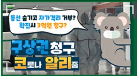
[코로나 뭉든 알리 줌 2편] 동선 숨기고 자가 격리 거부? 구상권에 관한 모든 것