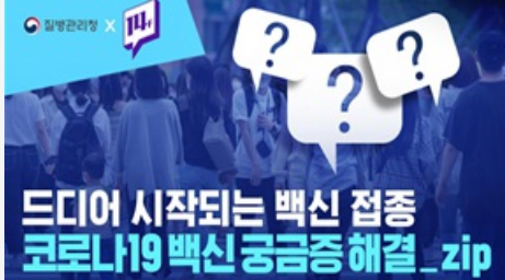
드디어 시작되는 백신 접종 코로나19백신 궁금증 해결