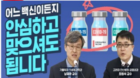
어느 백신이든지 안심하고 맞으셔도 됩니다