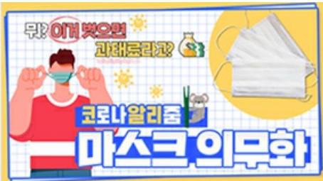
[코로나 뭉든 알리 줌 3편] 뭐? 이거 벗으면 과태료 부과?! 마스크 의무화의 모든 것