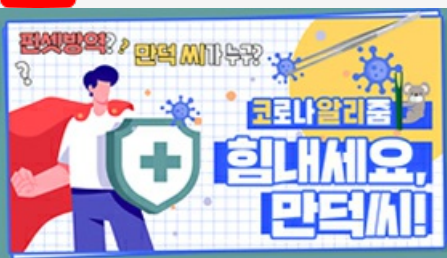
[코로나 뭐든 알리줌 5편] 힘내세요 만덕씨