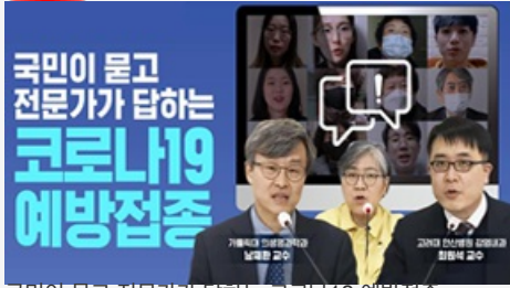
국민이 묻고 전문가가 답하는 코로나19 예방접종