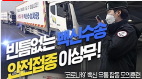
비틈없는 백신수송 안전접종 이상무! 코로나19 백신 유통 합동 모의훈련