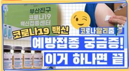
[코알리 워든 알리줌 11편] 부산 코로나19 백신 예방접종 시작