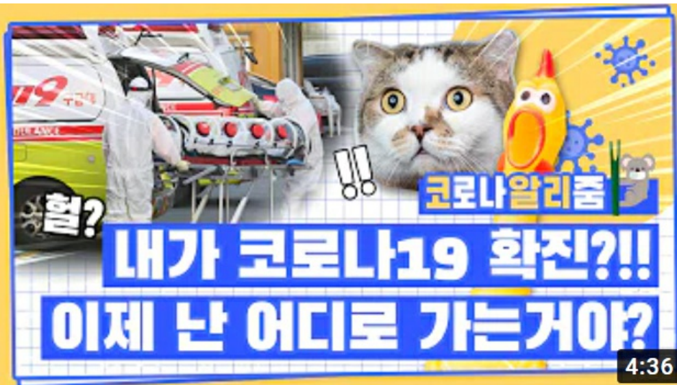
[코로나 뭐든 알리줌 8편] 코로나19 확진자가 되면 생기는 일