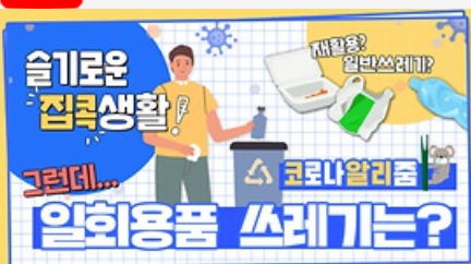
[코로나 뭐든 알리줌 7회] 우리의 지구를 부탁해 똑똑한 슬기로운 집콕생활!