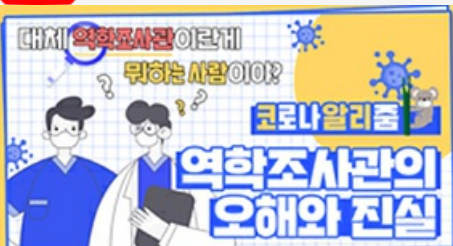
[코로나 뭐든 알리줌 4편] 역학조사관의 오해와 진실! 부산시 역학조사반은 어떤 일을 할까?