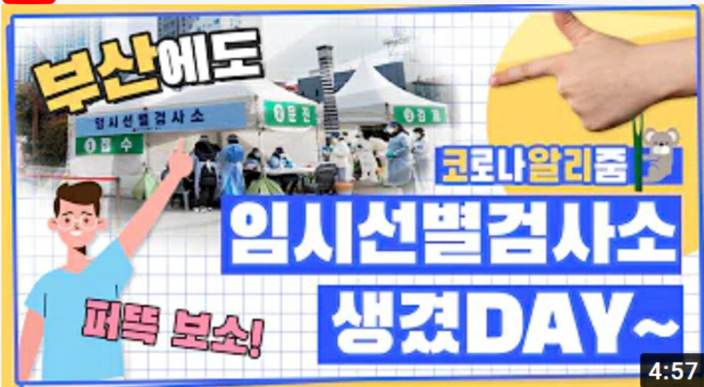
[코로나 뭐든 알리줌 9편] 부산에도 임시선별검사소 생겼DAY~