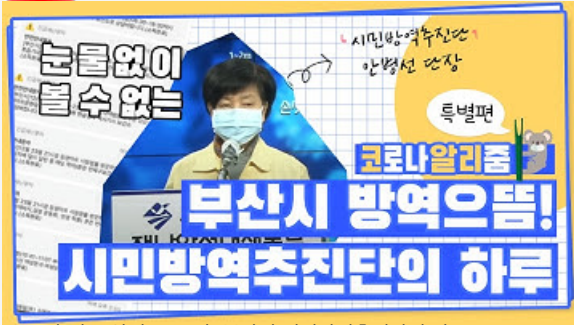
[코로나 뭐든 알리줌 10편] 부산시 시민방역추진단의 하루