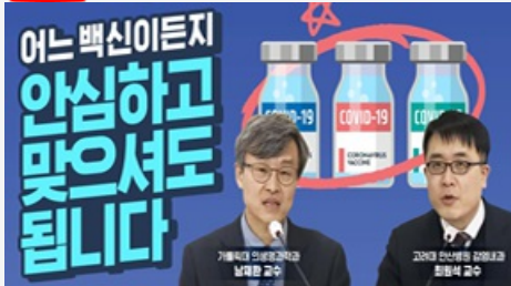
어느 백신이든지 안심하고 맞으셔도 됩니다