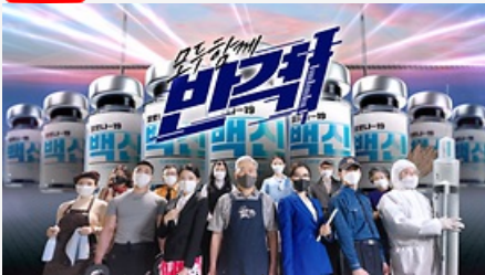
모두함께 반격! 백신접종 시작!