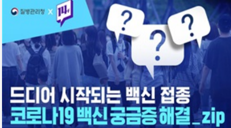
드디어 시작되는 백신 접종 코로나19백신 궁금증 해결