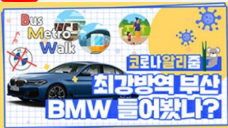
[코로나 뭐든 알리줌 6편] 부산 BMW 믿어도 되나??