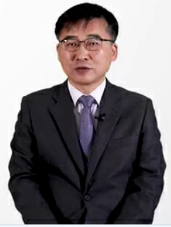
코로나19 예방접종 교육 영상