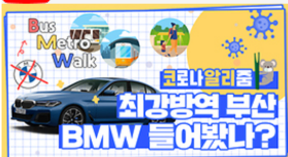
[코로나 뭐든 알리춤 6편] 부산 BMW 믿어도 되나??