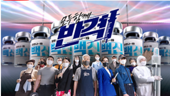
모두함께 반격! 백신접종 시작!