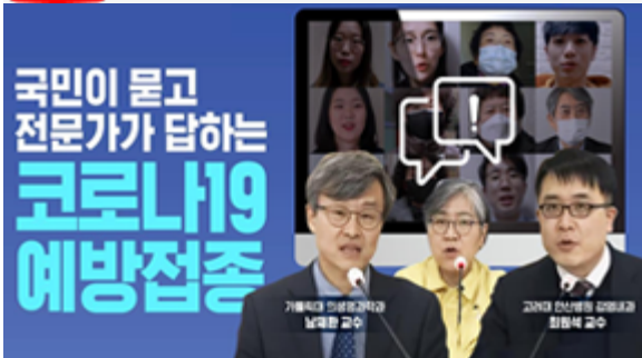
국민이 묻고 전문가가 답하는 코로나19 예방접종