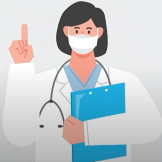
코로나19 쉽고빠른 온라인 예방접종