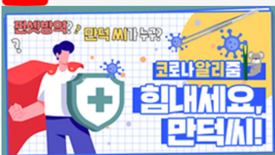
[코로나 뭐든 알리춤 5편] 힘내세요 만덕씨