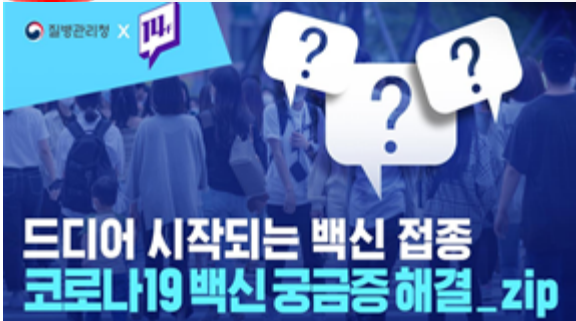
드디어 시작되는 백신 접종 코로나19백신 궁금증 해결