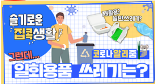
[코로나 뭐든 알리춤 7회] 우리의 지구를 부탁해 똑똑한 슬기로운 집콕생활!