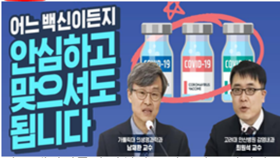
어느 백신이든지 안심하고 맞으셔도 됩니다