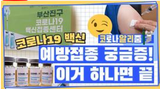
[코알리 뭐든 알리zum 11편] 부산 코로나19 백신 예방접종 시작