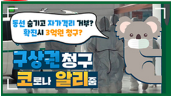
[코로나 뭐든 알리줌 2편] 동선 숨기고 자가격리 거부? 구상권에 관한 모든 것