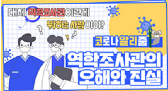
[코로나 워든 알리zum 4편] 역학조사관의 오해와 진실! 부산시 역학조사반은 어떤 일을 할까?