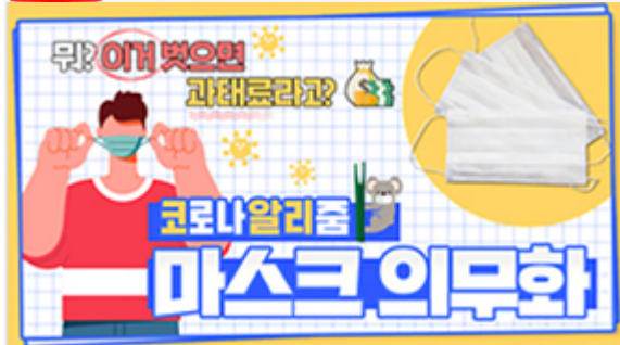
[코로나 워든 알리zum 3편] 뭐? 이거벗으면 과태료 부과?! 마스크 의무화의 모든 것