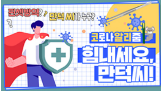
[코로나 워든 알리zum 5편] 힘내세요 만덕씨