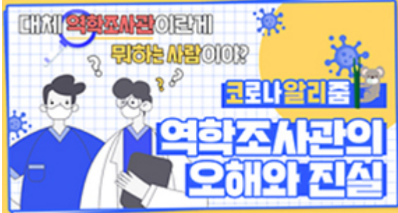
[코로나 워든 알리zum 4편] 역학조사관의 오해와 진실! 부산시 역학조사반은 어떤 일을 할까?