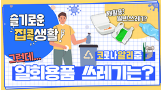
[코로나 워든 알리zum 7회] 우리의 지구를 부탁해 똑똑한 슬기로운 집콕생활!