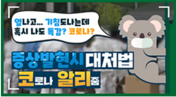
[코로나 뭐든 알리썸 1편] 열나고 기침도 난다! 나도 혹시 독감? 코로나?

Copyright © Busan Metropolitan City. All rights reserved.