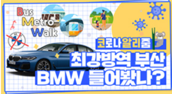
[코로나 워든 알리zum 6편] 부산 BMW 믿어도 되나??