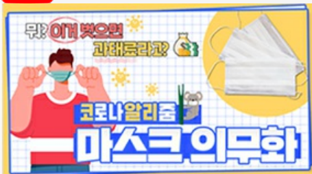
[코로나 뭐든 알리줌 3편] 뭐? 이거 벗으면 과태료 부과?! 마스크 의무화의 모든 것