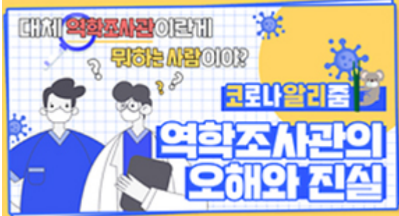
[코로나 워든 알리zum 4편] 역학조사관의 오해와 진실! 부산시 역학조사반은 어떤 일을 할까?