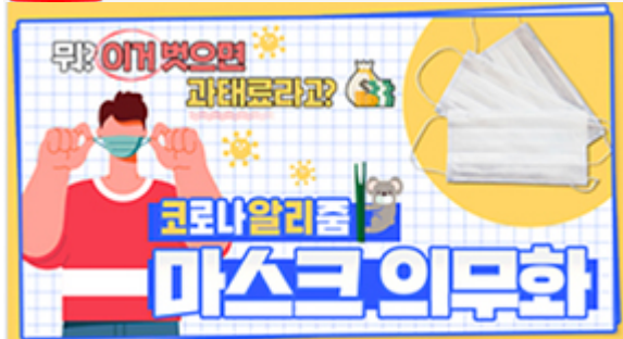
[코로나 워든 알리zum 3편] 뭐? 이거벗으면 과태료 부과?! 마스크 의무화의 모든 것