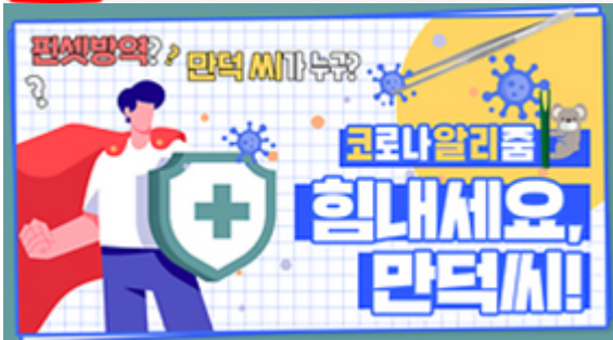
[코로나 워든 알리zum 5편] 힘내세요 만덕씨