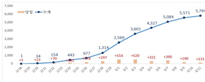
대구지역 코로나19 확진자 추세 (3.11(수), 00:00기준)

※ 신고지 기준으로 우선 집계된 현황으로 주민등록주소지 등이 다를 경우 추후 변경될 수 있음