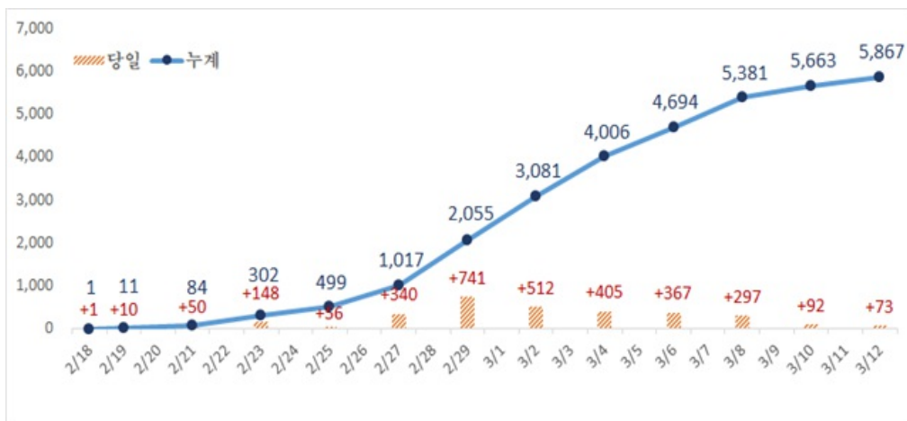
대구지역 코로나19 확진자 추세 (3.12(목), 00:00기준)