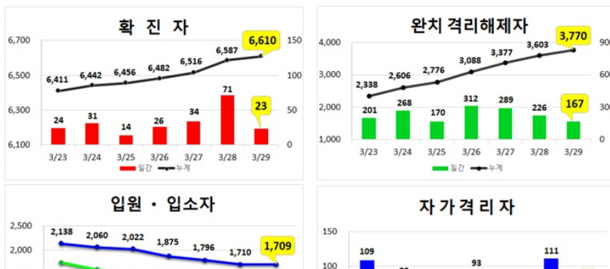
대구지역 주간 환자 동향 (3.29.(일), 00:00기준)