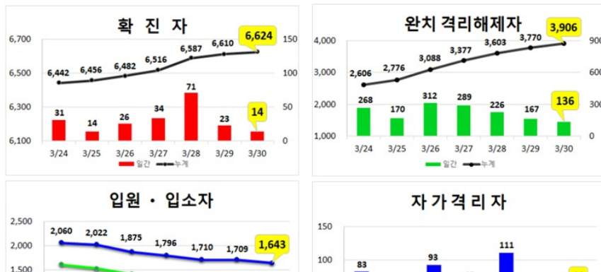
대구지역 주간 환자 동향 (3.30.(월), 00:00기준)

* 입원·입소자(2,634명) : 병원 67개소 1,643명, 생활치료센터 12개소 991명 ** 확진자 수는 질병관리본부 공식 발표자료에 의함.