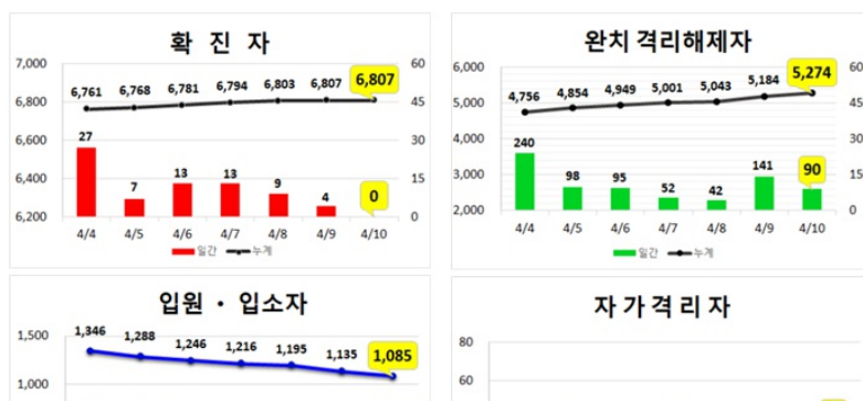
대구지역 주간 환자 동향 (4.10.(금), 00:00기준)