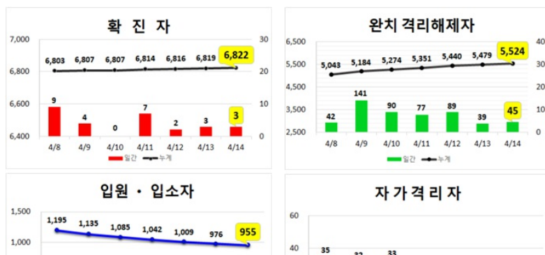
대구지역 주간 환자 동향 (4.14.(화), 00:00기준)

* 입원·입소자 : 병원 53개소 916명, 생활치료센터 250명 ** 확진자 수는 질병관리본부 공식 발표자료에 의함