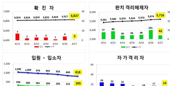
대구지역 주간 환자 동향 (4.17.(금), 00:00기준)