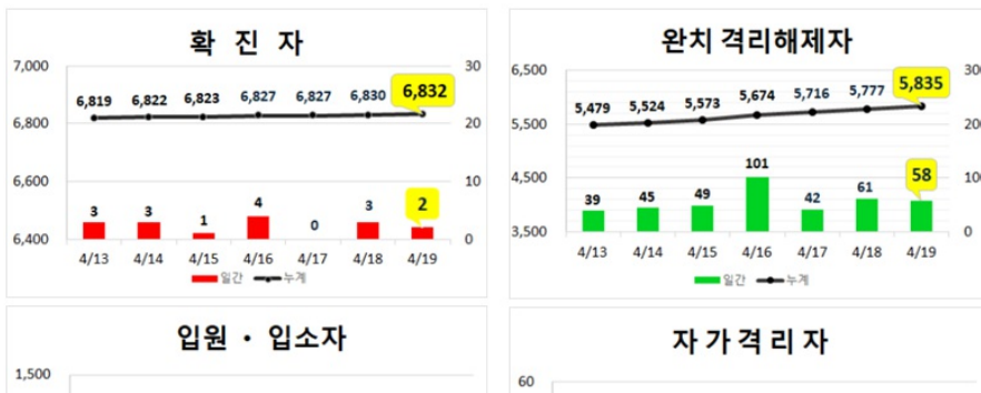
대구지역 주간 환자 동향 (4.19.(일), 00:00기준)

* 입원·입소자(911명) : 병원 47개소 750명, 생활치료센터 3개소 161명 ** 확진자 수는 질병관리본부 공식 발표자료에 의함