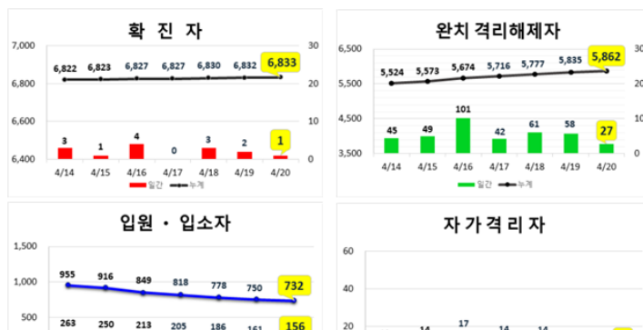
대구지역 주간 환자 동향 (4.20.(월), 00:00기준)