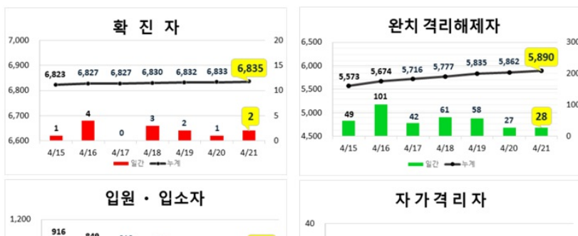
대구지역 주간 환자 동향 (4.21.(화), 00:00기준)

* 입원·입소자(861명) : 병원 47개소 717명, 생활치료센터 3개소 144명 ** 확진자 수는 질병관리본부 공식 발표자료에 의함